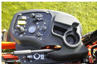
Das Kontrollboard des Jacobsen GP400

Auch das Kontroll- und Bedienerboard wurde neu gestaltet. Es umfasst weiterhin den typischen Joystick für die einfache Steuerung der Mäheinheiten. Auf Wunsch können diese auch über eine optionale Bedienung direkt an der Lenksäule gesteuert werden.