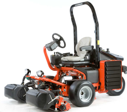
Der neue Jacobsen GP400

Der neue Grünsmäher basiert technisch auf dem Vorgängermodell und übernimmt auch dessen herausragende Eigenschaften wie die ausschwenkbare mittlere Mäheinheit, die legendären Schneideeinheiten mit 7, 9 oder 11 Messern und einen Kubota 3-Zylinder Dieselmotor mit 14 kW bei 3.200 U/min.