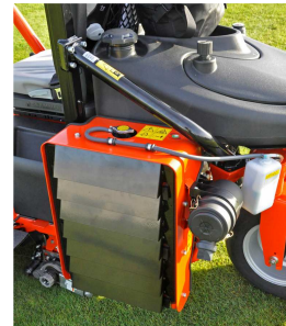
Kühler mit geräuschabweisenden Panels

Neu ist auch die verstärkte Batterieabdeckung, die einen Zugang zu den Batterien erlaubt, ohne dass der Sitz angehoben werden muss. Der neugestaltete, serienmäßige Überrollbügel und ein verstärktes Chassis sorgen für einen um 50% reduzierten Vibrationspegel gegenüber dem Vorgängermodell. Ebenso wurde der Geräuschpegel reduziert, dafür sorgen u.a. der neu positionierte Luftfilter sowie geräuschabweisende Panels über dem Kühler.